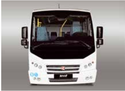
Ön Sis ve Gündüz Farları