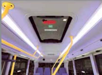
Yolcu Bölümü Aydınlatması (Tavan Işık Yolu)