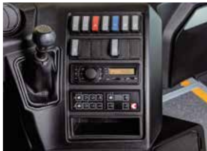
Yeni Klima ve Klorifer Kumanda Kontrol Paneli