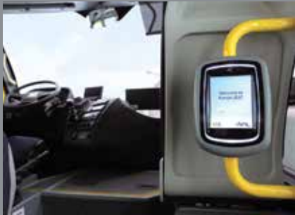
Validatör Hazırlığı (Opsiyonel)