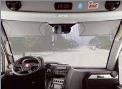
Sürücü Güneşliği (Standart), Yolcu Güneşliği (Opsiyonel)