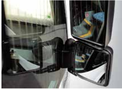
Açılır Yolcu Camı ve Resistanslı Cam (sağ)