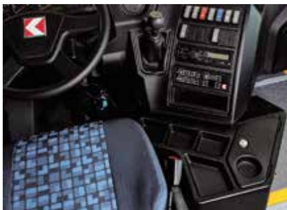
Bozuk Para Koyma Gözleri