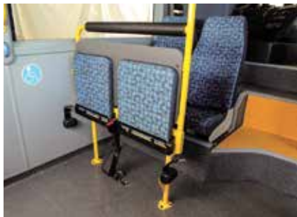
Yüksek Yolcu Kapasitesi