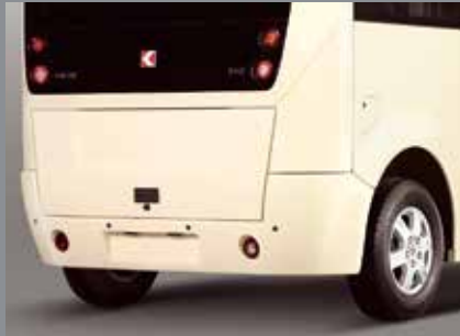
Park Sensörleri (Opsiyonel)