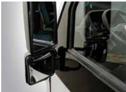
İlave Kaldırım Aynası